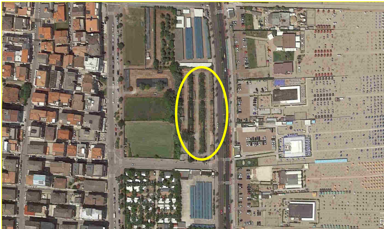
IMMAGINE DA SATELLITE